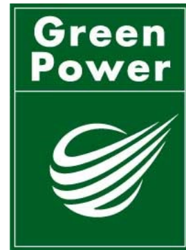
日本自然エネルギー株式会社が発行するグリーン電力の利用を証するマーク

グリーン電力証書システムは、再生可能エネルギーにより発電された電力（グリーン電力）の環境付加価値を、証書発行事業者が一般財団法人日本品質保証機構の認証を得て、「グリーン電力証書」という形で取引する仕組みです。企業はグリーン電力証書を購入することにより、自らが発電設備を持たなくとも、証書に記載された電力量（kWh）相当分が再生可能エネルギーによって発電されたものとする事が可能となります。グリーン電力証書に記載された電力相当分の再生可能エネルギーの普及に貢献したものとみなすことができるため、温暖化の原因となる二酸化炭素を抑制する仕組みとして注目されています。