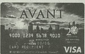
〈20周年記念優待カード〉